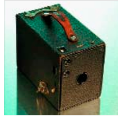
Box-Kamera, ca. 1920. Beim Kauf eines 120 Rollfilms wurde die Kamera geschenkt.