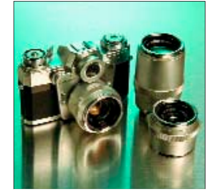
Spiegelreflex-Kamera für Profis, ca. 1960