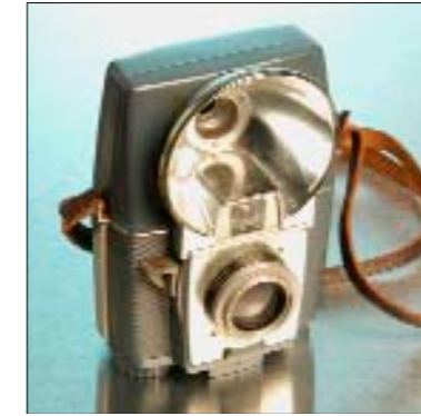
Kamera für Damen ca. 1950